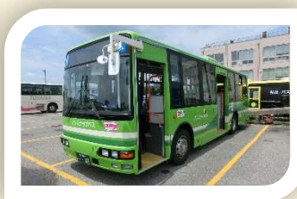
路線バス乗り方教室