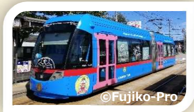
ドラえもんトラム