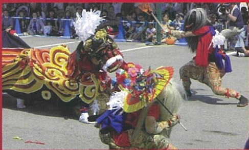
法土寺町獅子舞保存会(新湊) (ほうどじまち ししまいほそんかい)