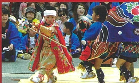
和田保育園(高岡市) (わだ ほいくえん)