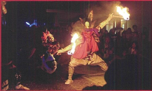
立野東町青年団(高岡市) (たてのひがしまち せいねんだん)