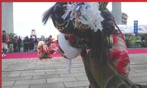
四十物町獅子方若連中(新湊) (あいものちょう ししかたわかれんちゅう)