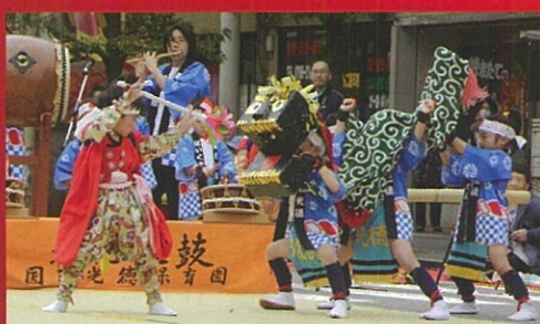
国吉光徳保育園(高岡市) (くによしこうとく ほいくえん)