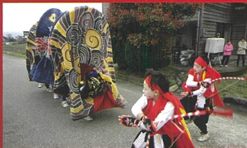
大塚獅子舞保存会(富山市) (おおつか ししまいほそんかい)