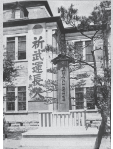
片原町旧高岡市役所前の垂れ幕「祈武運長久」 (1935~45年)