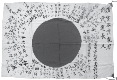
日の丸寄せ書き (1935~45年) 当館蔵