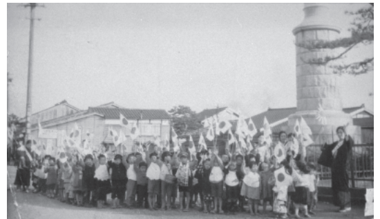
出征兵士を送る幼児たち (高岡市伏木 / 1935~45年) 伏木保育園蔵