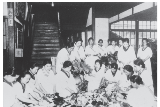
大日本国防婦人会の奉仕活動 (1935年)